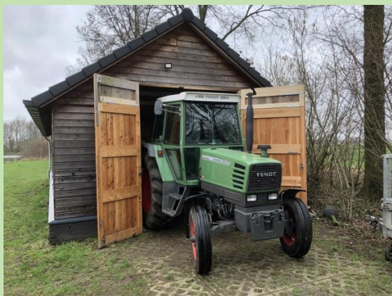
't kan krek