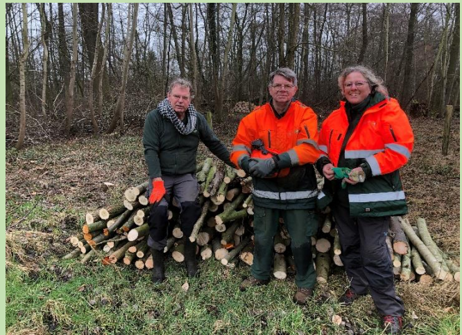
Hakhoutbeheer - Schreuders Weide - Haarlo