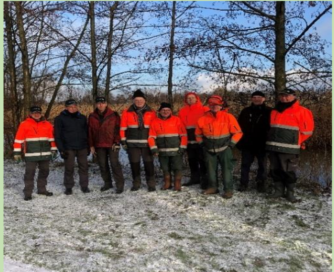
Wilgen knotten - Terrein D'n Leeg'n Könningstool Zieuwent