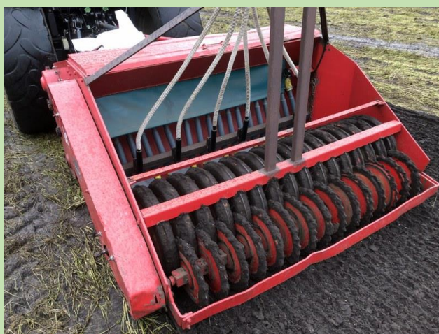
Inzaaien winterrogge door Agrec Zelle Beheer