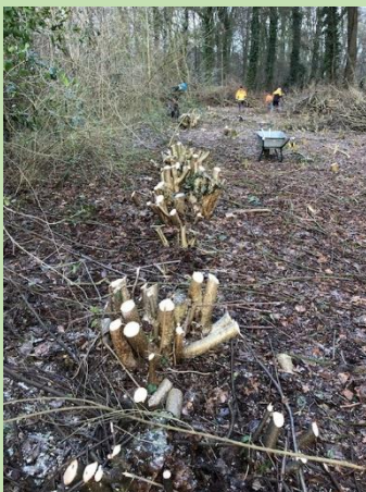
Afzetten van de hazelaars in de houtsingel op terrein Ligtenbargs Weide