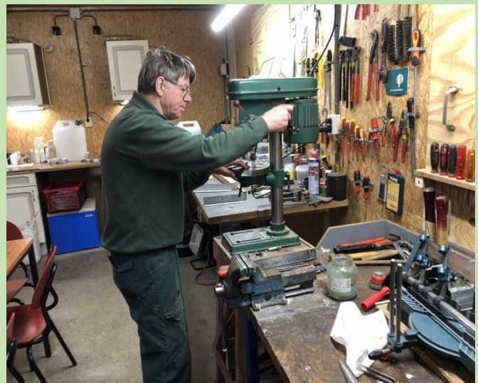
Om misverstanden te voorkomen: dit is geen biertap maar een boormachine! 😄