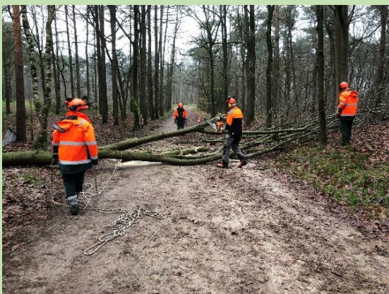
Verwijderen Amerikaanse eiken Beelaertsbos in Barchem