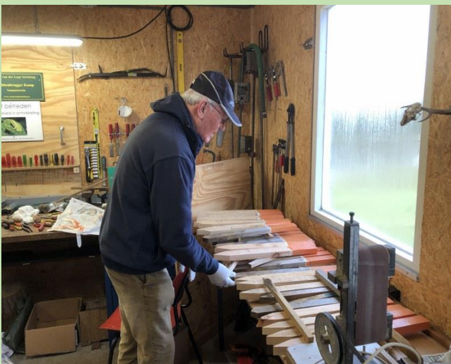
Buiten is het guur en nat, binnen klusjes dus