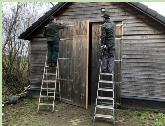
De deuren werden verhoogd met gerecycled hout