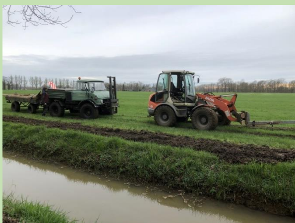
Vast in de zuigende klei

Helaas, het perceel is lastig te bereiken en de vette klei in het naastgelegen weiland wilde niet echt meewerken. Frank kwam met z'n Unimog met aanhanger vast te zitten en moest met hulp van een tractor weer op het rechte pad gezet worden.