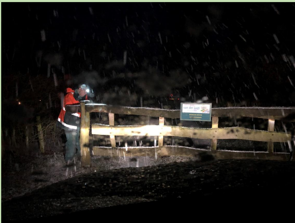
Het overtuigende bewijs dat onze vrijwilligers (Leo Romijn) zich bij nacht en ontij en in weer en wind inzetten