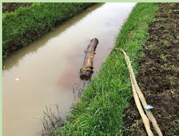
Houttransport (noodgedwongen) via het water