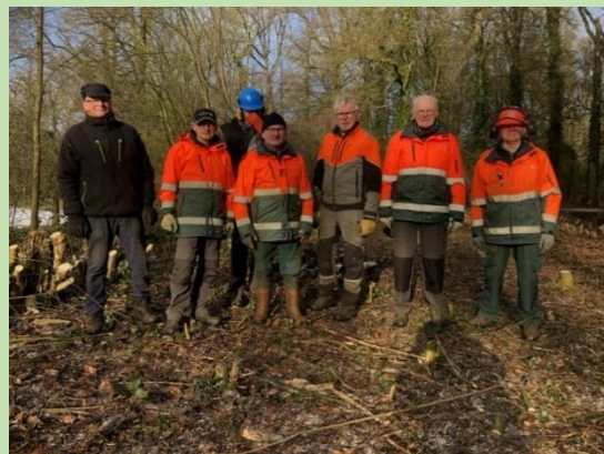
Werkploeg Ligtenbargs Weide