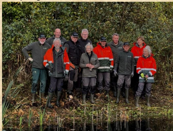
Werkploeg poelen Horstermaat