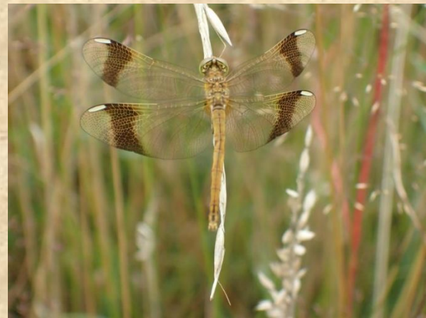
Bandheidelibel Schreuders weide - Haarlo