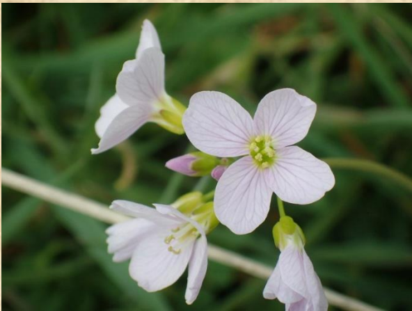
Waterviolier Bosmans Broom Marienvelde