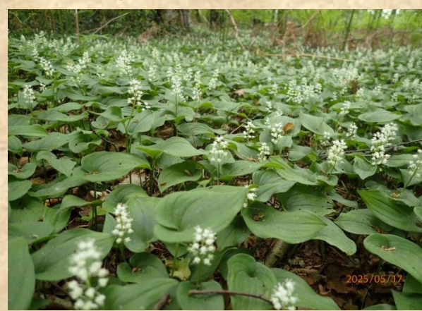
Dalkruid – Sieverinksbos Ruurlo

De Van der Lugt stichting zet zich in voor natuur, landschap, biodiversiteit en cultuur in de Achterhoek