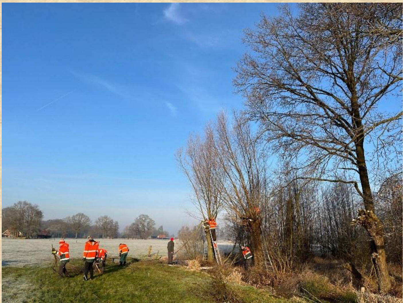
Wilgen knotten – Tichelmansbos

info@vanderlugtstichting.nl www.vanderlugtstichting.nl