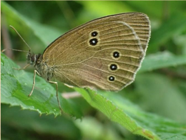
Koevinkje Schreuders weide - Haarlo