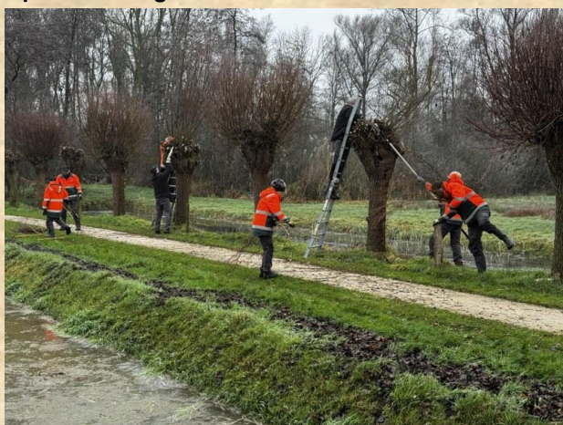
Wilgen knotten D'n Leeg'n Könningsstool – Ziewent