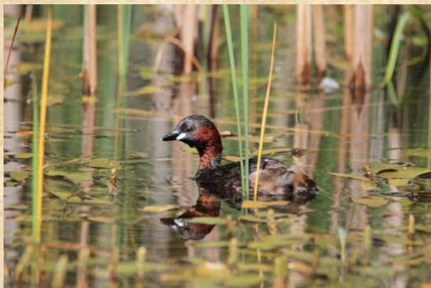
Dodaars – Bosmans Brook