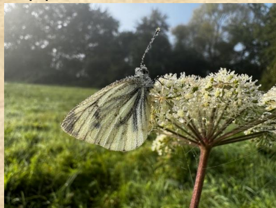
Geaderd witje – Schreuders weide