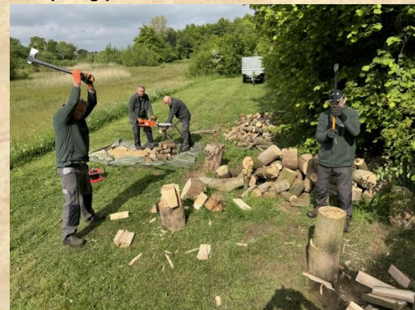
Werkploeg kloven en zagen Bosmans Brook

De Van der Lugt stichting zet zich in voor natuur, landschap, biodiversiteit en cultuur in de Achterhoek