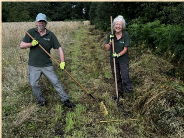
Opruimen singel Sieverinkses - Ruurlo