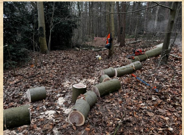
Risico bomen en Amerikaanse eiken - Beelaetsbos in Barchem