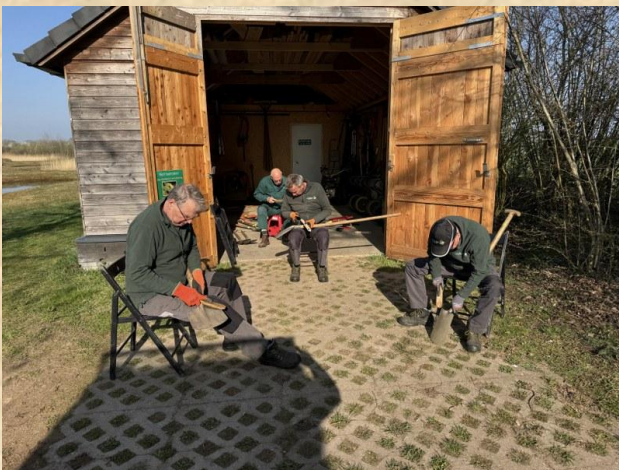
In 't zonnetje: slijpen, schoonmaken

Naast het werk in het veld is er ook onderhoud aan gereedschap en de veldschuur nodig en nog veel andere klussen gedaan moeten worden om de “zaak” draaiende te houden. Al dat werk wordt, ook tijdens natte, koude en zware omstandigheden met groot enthousiasme opgepakt en uitgevoerd.