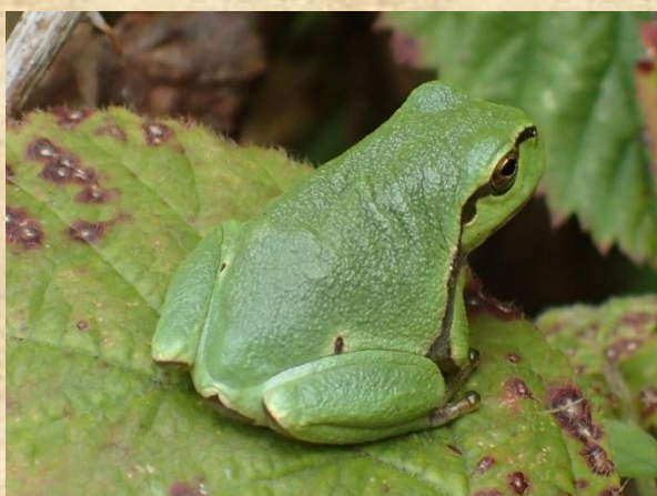
Boomkikker – Bosmans Brook

De mooie dingen en successen die we samen bereikt hebben, allemaal het resultaat van hard werk met passie voor de Achterhoekse natuur. Het werk in onze terreinen en aan ons mooie Achterhoekse landschap is nooit gedaan en voor anderen niet altijd direct zichtbaar. Maar de wetenschap dat we samen werken om de natuur in de Achterhoek te verstevigen geeft ongelooflijk veel voldoening. Zeker als je “oog voor detail” hebt. We deden ook dit jaar weer mooie waarnemingen: