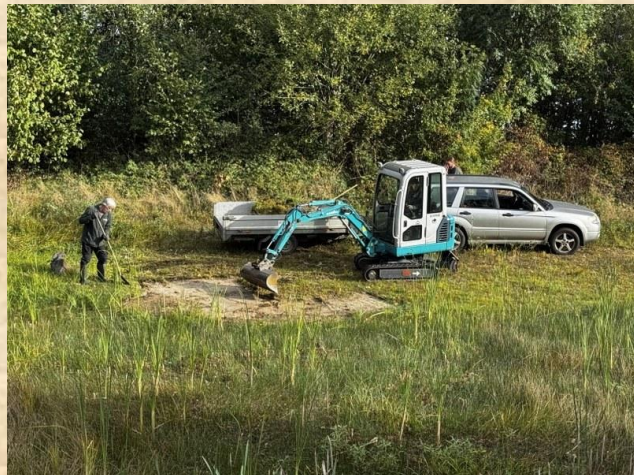
Verwijderen Watercrassula Bosmans Brook Mariënvelde