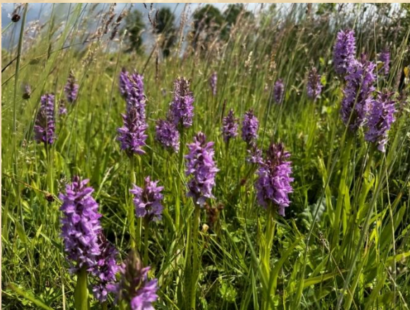
Gevlekte orchis Bosmans Brook Marienvelde