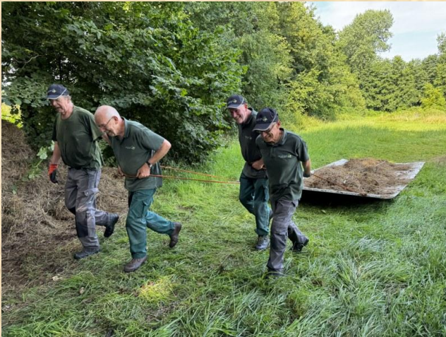
Gebruik sleepzeilen Schreuders Weide - Haarlo –

Voorals de weer- en terreinomstandigheden het werken met machines moeilijk maakt is het ouderwetse handwerk onontbeerlijk. Na wat geëxperimenteer werd een methode ontwikkeld om met sleepzeilen het maaisel uit zwaar terrein af te voeren. Hierdoor ontstaat geen insporing en bodemverdichting van het terrein