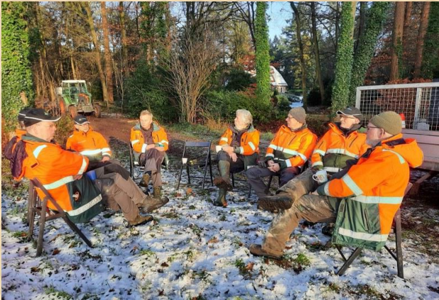
Bikkels in de kou

In 2025 zijn door een externe expert controles uitgevoerd naar risicobomen. Delen van onze bossen liggen langs openbare (zand)wegen of fietspaden. Doel van de inventarisatie is om tijdig en aantoonbaar beheermaatregelen te kunnen nemen om schade(claims) en ongelukken te voorkomen. In 2025 is gestart met het vellen van risicobomen op de percelen Sieverinksbos en Beelaetsbos.