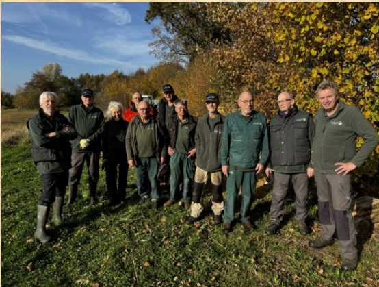
Werkploeg Bosmans Brook

Voor het derde achtereenvolgende jaar werd een recordaantal uren gewerkt door de vrijwilligers. Uiteindelijk stond op 31 december 2025 de teller op 2284 uren . Daarmee is de vrijwilligersgroep van de stichting recordhouder van alle actieve vrijwilligersgroepen in Gelderland. Hulde!