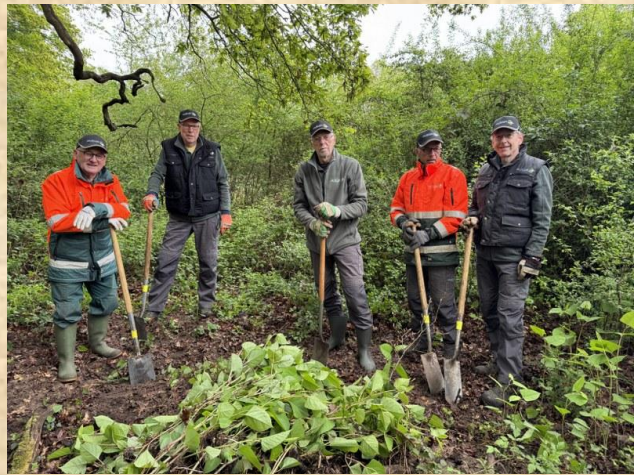
Bestrijden Japanse Duizendknoop Ligtenbargs weide - Borculo

Naast het werk in het veld is er ook onderhoud aan gereedschap en de veldschuur nodig en nog veel andere klussen gedaan moeten worden om de “zaak” draaiende te houden. Al dat werk wordt, ook tijdens natte, koude en zware omstandigheden met groot enthousiasme opgepakt en uitgevoerd.