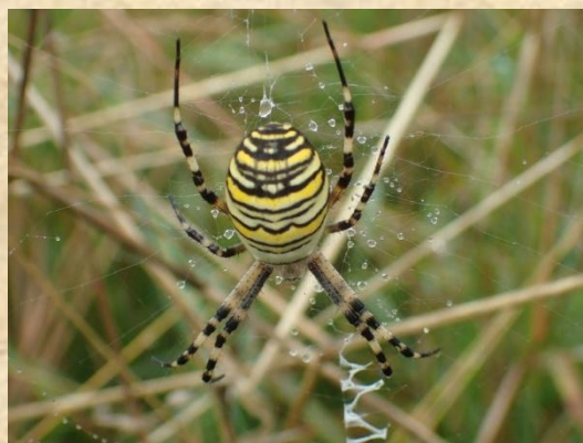
Wespspin – Schreuders weide