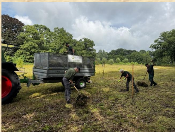
Werkploeg Ligtenbargs Weide