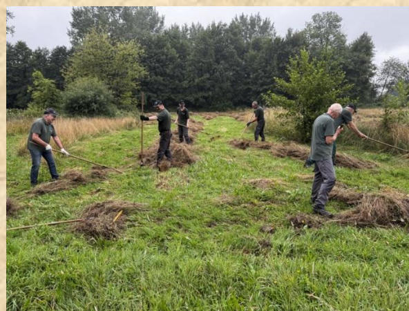
Harkdagje op Schreuders weide - Haarlo