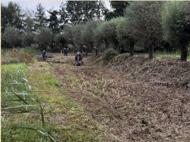
Drooggevallen poel D'n Leeg'n Könningstool

Opnieuw werd in de poel Bosmans Brook Watercrassula aangetroffen. IN 2025 werden delen van de oevers afgeplagd en de planten werden in een diepe kuil begraven.