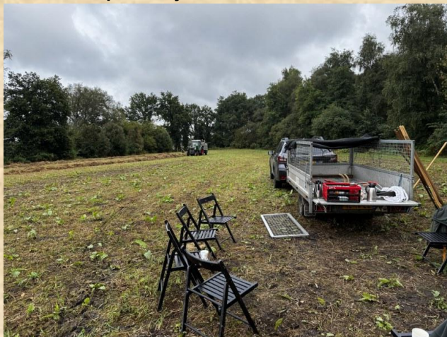
Afvoeren van het maaisel