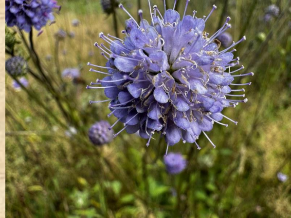
Blauwe knoop Bosmans Brook – Marienvelde