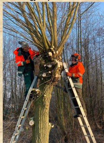
Wilgen knotten Tichelmansbos – Ruurlo