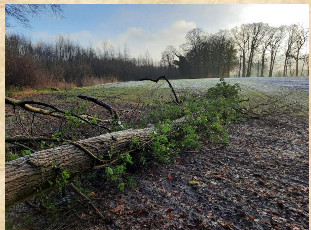
Valhout op de akker terrein Oedingsebeekdal

De Van der Lugt stichting zet zich in voor natuur, landschap, biodiversiteit en cultuur in de Achterhoek