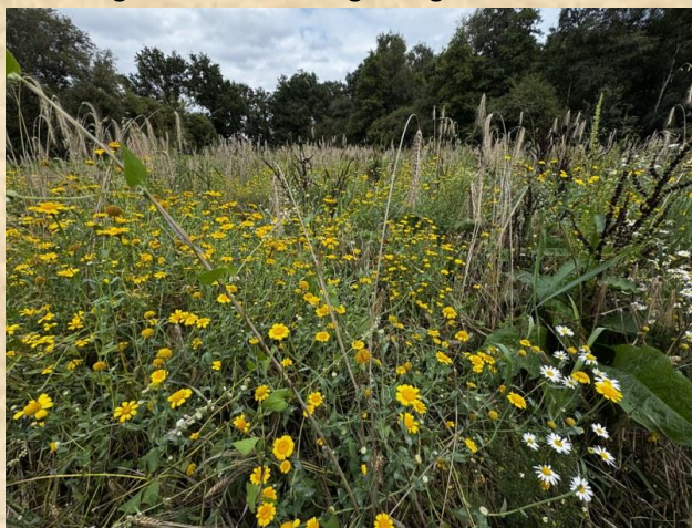
Gele ganzenbloem met echte kamille