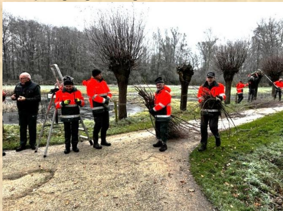
Wilgen knotten D'n Leeg'n Könningstool