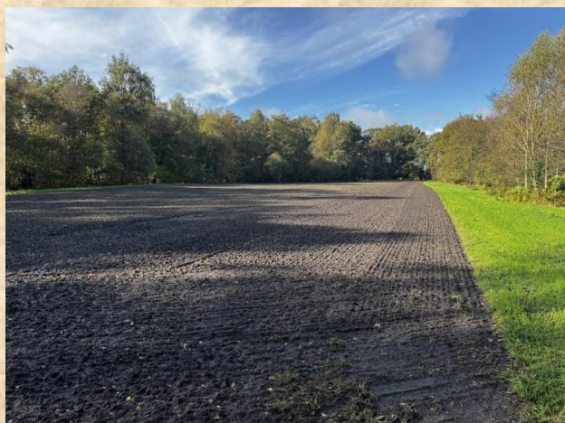
Mooi ingezaaid met biologisch graan

Op de natuurakker stond in 2025 winterrogge. In de herfst van 2025 is de akker in Ruurlo door Agrec Zelle Beheer ingezaaid met wintergerst