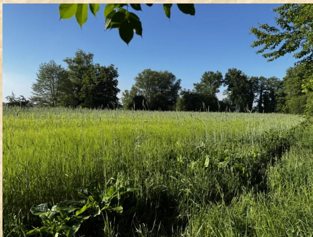
Het staat er prima bij