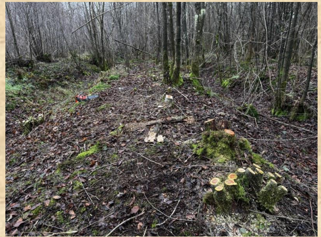
Vochtig hakhout op het rabattenbos van de Laarbraak bij Ruurlo