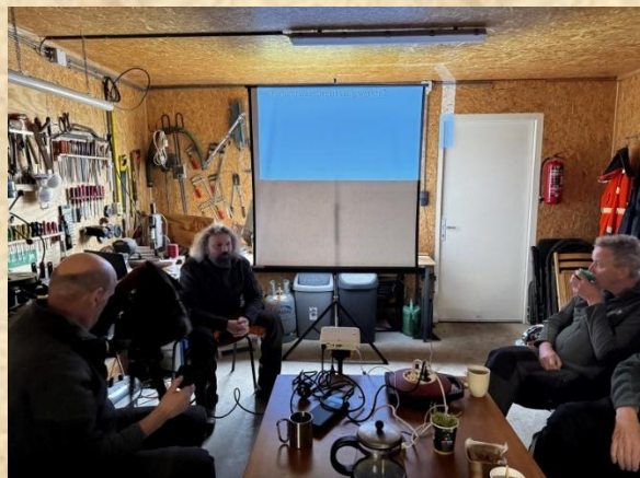
Deelnemers workshop "zagen en veiligheid"

De Van der Lugt stichting zet zich in voor natuur, landschap, biodiversiteit en cultuur in de Achterhoek