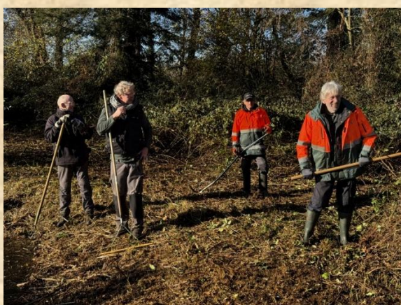
Werkploeg poelen Horstermaat