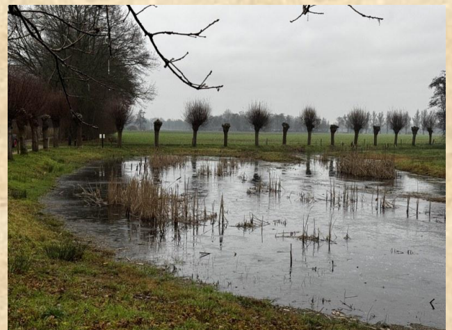
Mooie winterklus – wilgen knotten terrein D'n Leeg'n Könningstool langs t kerkepad bij Zieuwent

De Van der Lugt stichting zet zich in voor natuur, landschap, biodiversiteit en cultuur in de Achterhoek