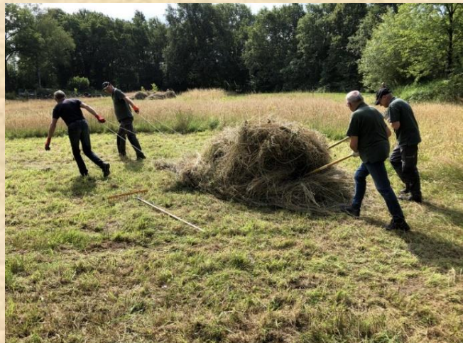
Gebruik van een sleepzeil