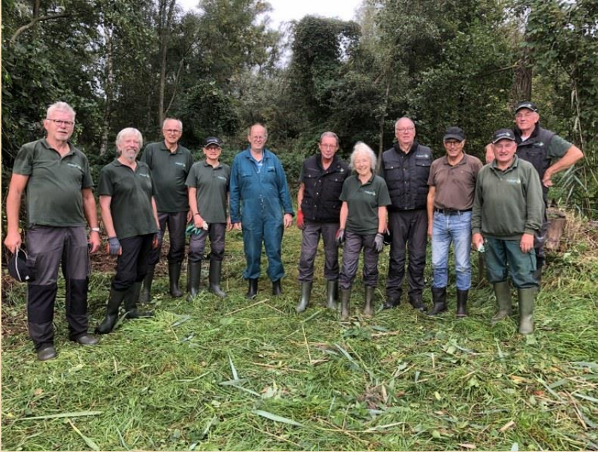
Werkploeg D'n Leeg'n Könningstool bij Zieuwent

Veiligheid is ook gericht op gezondheid. In de vorige beleidsperiode zijn vrijwilligers in de gelegenheid gesteld om beschermend schoeisel, functionele kleding, gehoorbescherming aan te schaffen. Dat beleid wordt (mits financieel haalbaar) gecontinueerd en geldt dus ook voor nieuwe vrijwilligers die zich aanmelden.