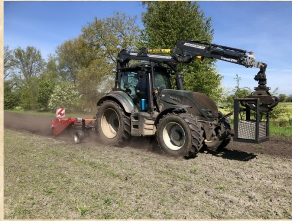
Kweekbestrijding met de Kwick Finn op Sieverinkses