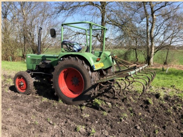
Geen grond-omkerende bewerkingen

Op de twee akkers proberen we gericht beheer toe te passen om de ecologische waarde te verhogen. Als gevolg van jarenlang intensief agrarisch gebruik is de bodem te voedselrijk. Om de balans terug te vinden is een herstelbeheer nodig dat zich over een aantal jaren uitstrekt.