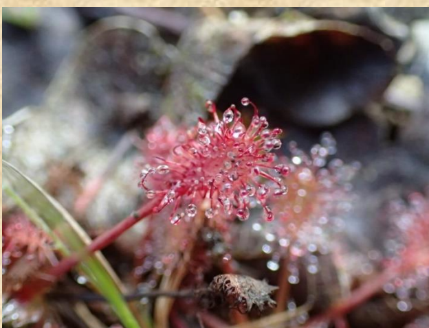
Zonnedauw – Horstermaat