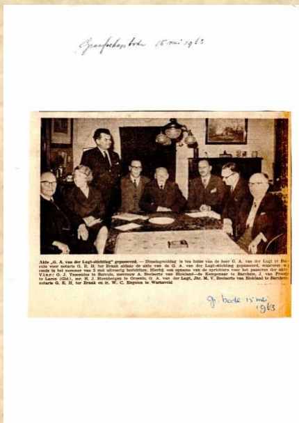
Oprichtingsvergadering mei 1963

De Stichting is in 1963 opgericht, aanvankelijk als restauratie- en publicatiefonds van de Oudheidkundige vereniging de Graafschap onder de statutaire naam G.A. van der Lugt stichting. De naam Van der Lugt stichting wordt gebruikt als werknaam. De stichting heeft (in de jaren '60) ook daadwerkelijk een monument gerestaureerd, namelijk het Spieker Kössink te Winterswijk-Huppel. Ook heeft de stichting in haar bestaan met enige regelmaat uitgaven op het gebied van de streektaal en streekgeschiedenis en lokale projecten op cultureel-historisch terrein financieel ondersteund.