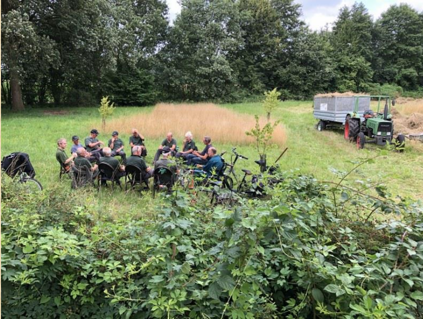
Werkploeg Schreuders Weide bij Haarlo