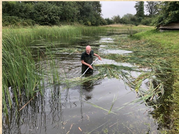
Schoonmaken / maaien van de poelen op Bosmans Brook bij Mariënvelde