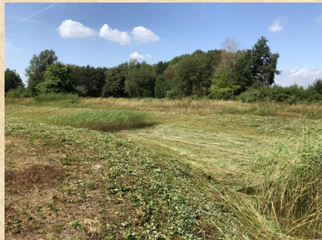
Natte en droge zomers wisselen elkaar af.

De druk op ons, als terreinbeheerder, om bomen zo hoog mogelijk op te kronen, sloten uit te baggeren en houtsingels kort te houden of volledig te kappen zal voorlopig blijven bestaan. Wat zeker gezien de beperkte omvang van onze terreinen een slechte zaak is voor de aanwezige flora en fauna, laat staan het herstel ervan.