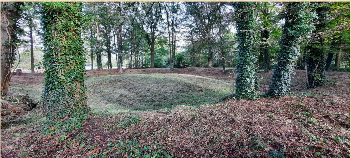
Rijks (archeologisch) monument de Ruitenburgerschans in het Woold

De Van der Lugt stichting wil haar werkzaamheden op dit terrein dus blijven voortzetten maar onderkent daarbij wel dat zij daar geheel zelfstandig organisatorisch en financieel niet toe in staat is. Om die reden zoekt de stichting dan ook vooral de samenwerking met de genoemde organisaties om publicaties die van voldoende kwaliteit zijn en waarvoor interesse bestaat bij het publiek, financieel mogelijk te maken. In bepaalde gevallen kan dat betekenen dat de stichting de steun 'beperkt' tot uitsluitend financiële ondersteuning van activiteiten die andere organisaties feitelijk uitvoeren. In de voorliggende periode zal tevens worden nagedacht over het vormgeven van strategische allianties voor de lange termijn.