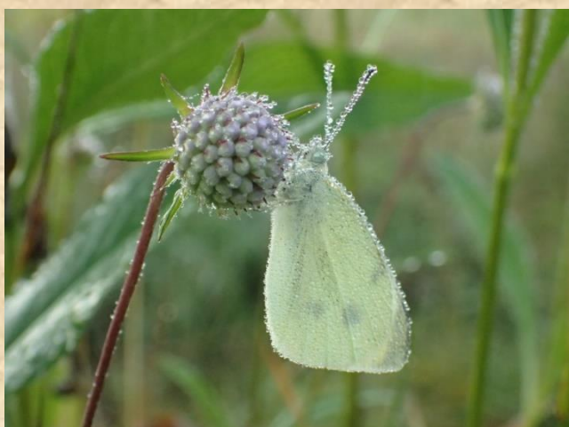
Koolwitje op Blauwe knoop Bosmans Brook