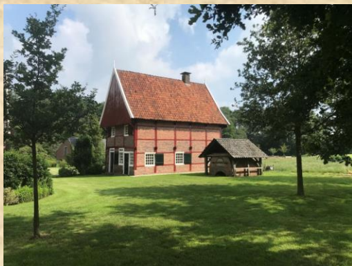
Kornspieker Kössink in Huppel Het eerste restauratieproject van de stichting in de jaren '60. In 2021 is de spieker in eigendom overgedragen aan GL&K