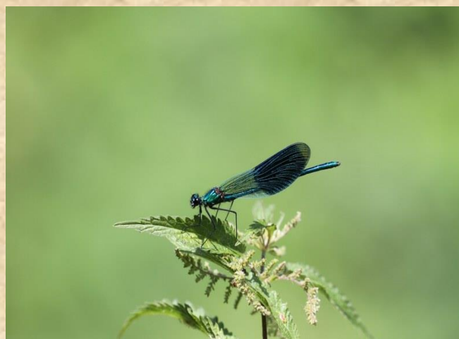
Weidebeekjuffer - Oedingsebeekdal