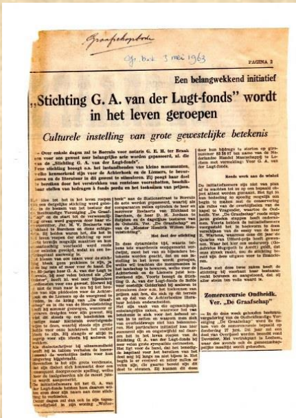
Artikel over de oprichting Graafschapbode