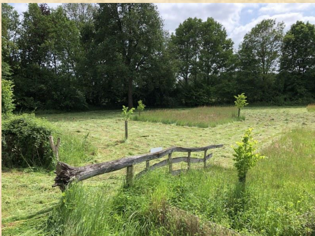
SINUS-beheer Schreuders Weide Haarlo

Op de rijkere delen waar verschraling gewenst is, passen we overgangsbeheer toe. Hierbij letten we altijd op de ecologische toestand.