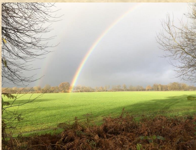
Uitzicht vanaf Sieverinkses - Ruurlo