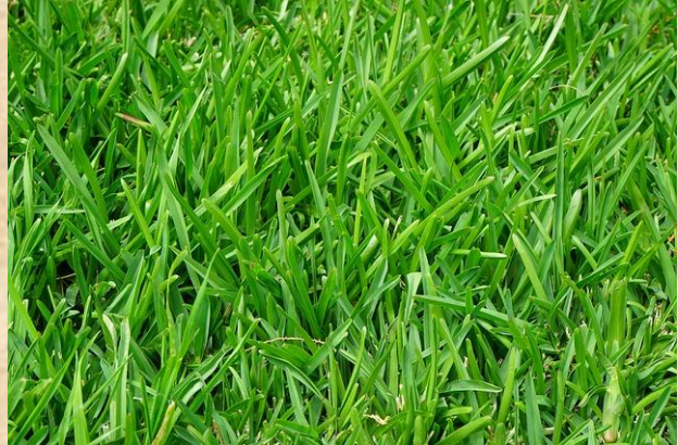
Florrijk hooiland vs. Raaigras