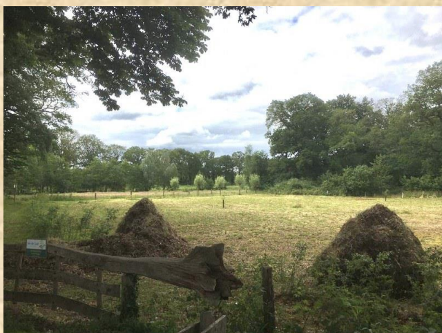
Muizenruiters op Ligtenbargs Weide