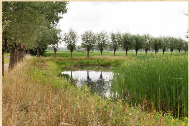
Het Achterhoekse landschap